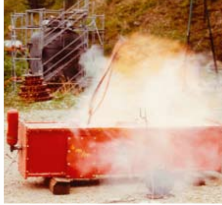
Bereits in den 70er Jahren wurden Explosionsschutzmaßnahmen getestet.