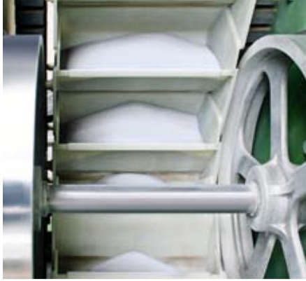
Die Gummiblockketten als Zugträger und das geschlossene Becherband bieten beste Voraussetzungen für den Einsatz in ATEX-Zonen.