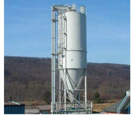
Silobeschickung durch ein Winkelbecherwerk mit Klärschlammgranulat.

|| In vielen Anwendungsbereichen ist bei der Auslegung der Fördertechnik eine mögliche Staubexplosionsgefahr zu berücksichtigen. Gerade die Vertikal-fördertechnik stellt in dieser Hinsicht besondere Ansprüche: